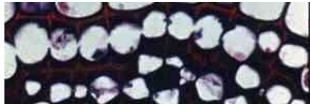
Abbildung 2: Plattenkollenchym, Oleaceae, Fraxinus spec.

Je nachdem welche Teile der Zellwand verdickt sind werden die unterschiedlichen Kollenchyme entsprechend ihrer Erscheinungsform als Platten- , Kanten- , Ecken- oder Lückenkollenchym bezeichnet. Wenn Sie in Blättern als Stabilisierungselement dienen werden sie als Kollenchym-, und später als Sklerenchymrippen um die Blattadern gelegt. Weitere Kollenchymstrukturen im Blatt sind Blattrandleisten, bei denen eine Beziehung zu externen mechanischen Beanspruchung nach ESCHERICH (1995) aber nicht ersichtlich ist.